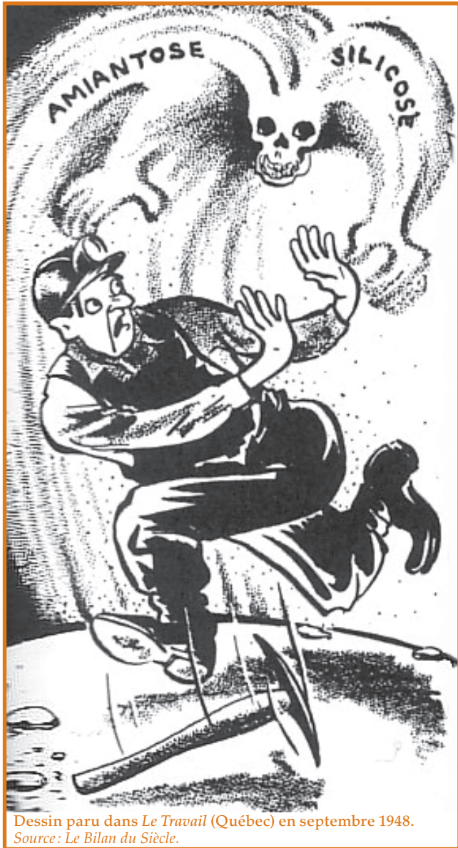
Dessin paru dans Le Travail (Québec) en septembre 1948.

travail: intensité de l'effort et donc de l'inhalation de poussières, exposition plus ou moins continue, rythme de rotation de la main-d'œuvre – sans parler des modalités de la mécanisation ou des techniques de prévention (par ventilation ou humidification, par exemple).